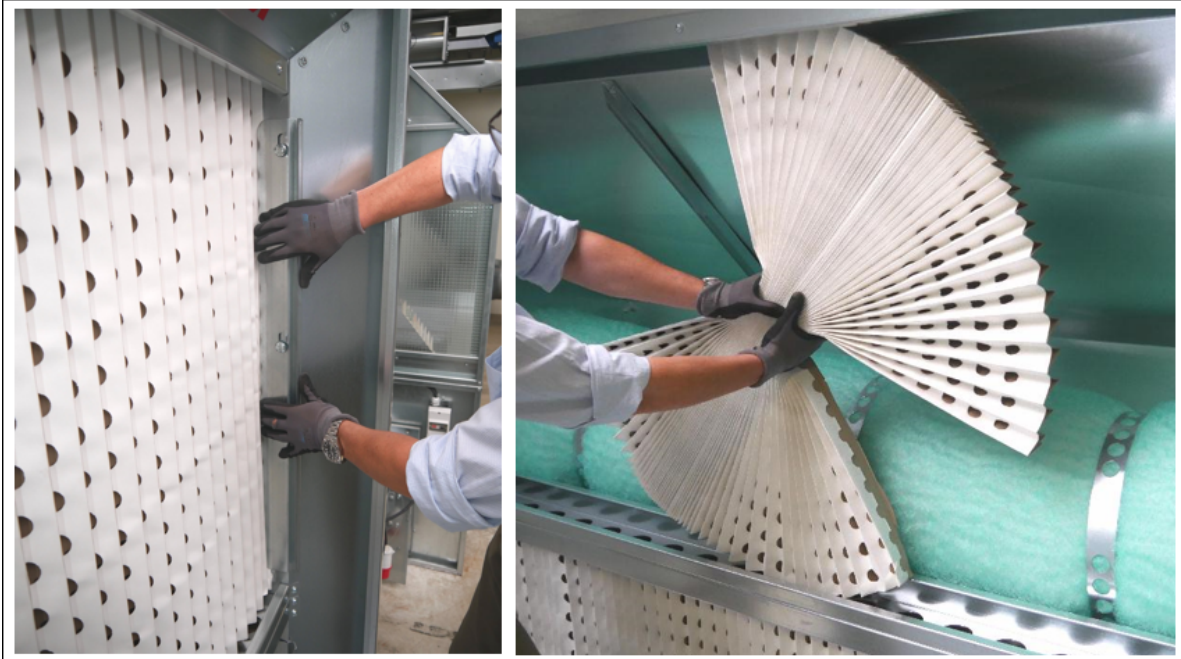
Bild links: Lösen bzw. Befestigen der seitlichen Halteklammern der Kartonfiltermatte.

Die Filtermatte (Zick-Zack-Filter) wird in einer oberen und unteren U-Schiene geführt. Die seitliche Befestigung erfolgt mittels Klemmleisten und Flügelschrauben. Nach dem Entfernen der seitlichen Klemmschienen kann der obere und untere Kartonfilter entnommen werden. Am einfachsten ist es wenn Sie die Filtermatte in der Mitte zusammendrücken und um 90 Grad drehen. Nach dem Entfernen der vorderen Filtermatte (Prallfläche) ist die Sekundär-Filtermatte sowie die Tertiär-Filtermatte frei zugänglich.