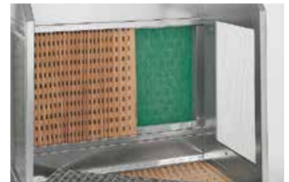
Die Filtermedien, Vor- und Feinfilter, sind bei Bedarf mit wenigen Handgriffen gewechselt.