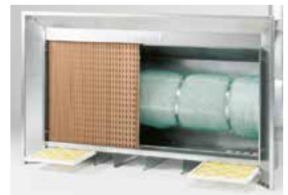
Leichte Zugänglichkeit sichert schnellen, problemlosen Wechsel der kostengünstigen Filter.