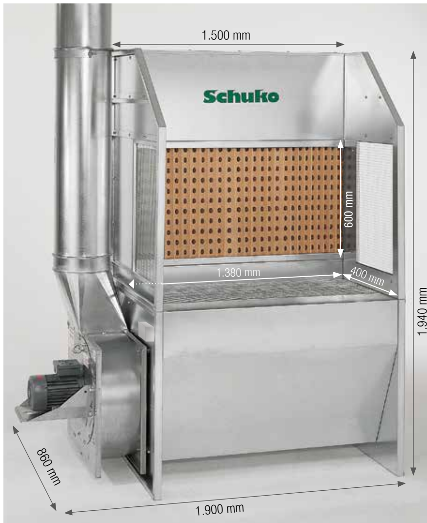
Das ideale Gerät für die Lacknebel- und Dunstabsaugung.

■ Der Schuko SAUGBOY lässt Ihre Mitarbeiter nicht länger im Nebel stehen. Das kompakte Gerät, speziell für Kleinteillackierungen entwickelt, bringt Schuko-Leistung zum günstigen Preis.