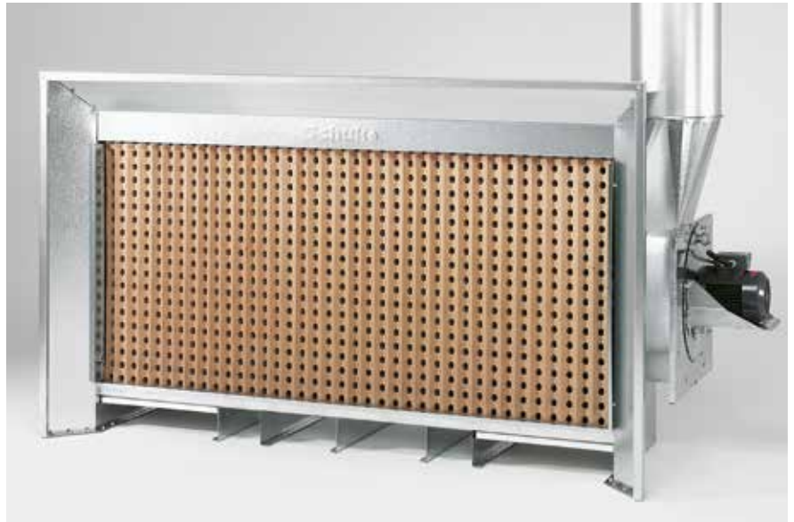
Solide Kompaktbauweise mit geringer Bautiefe – genau richtig für kleine Räume und Werkstätten.

Einfacher elektrischer Anschluss, kein zusätzlicher Schaltschrank erforderlich. Im Lieferumfang enthalten ist das Anschlusskabel mit 7 m Länge mit Motorschutzstecker und Schalter nach CEE für den Anschluss außerhalb des Ex-Bereiches.